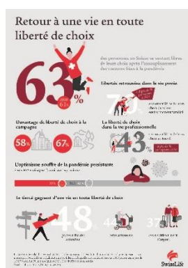
Retour à une vie en toute liberté de choix (PDF)